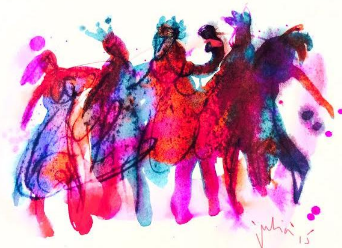
Il·lustració de Julià Pascual Fortea, 2015. Carmina Burana

Obra de Carl Orff que s'interpretarà aquest mes de novembre a l'Auditori de Barcelona (veieu el dia 8-XI), amb totes les seves rememoracions de l'ambient medieval i bàquic corresponent.